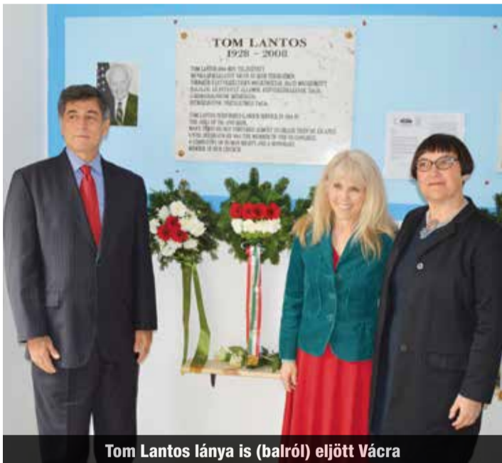
Tom Lantos lánya is (balról) eljött Vácra

A Duna-Ipoly-Galga régióból a vézskorszakban elhurcolt zsidó emberek előtt tisztelgő emlékmű felállítására, több kiadvány megjelentetése, a regionális holokauszt oktató- és kutató központ valamint a sírkerti kegyeleti tanösvény kialakítása után szeptember 19-én - a holokauszt emlékév újabb jeles váci eseményeként - egy-egy emléktáblát avattak az izraelita temetőben - idősebb Antall József, Henryk Slawik, Tom Lantos és Radnóti Miklós tiszteletére