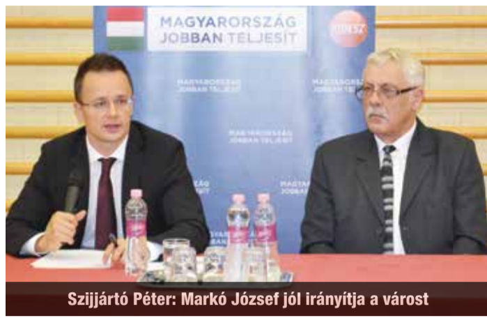
Szijjártó Péter: Markó József jól irányítja a várost

A polgármester hangsúlyozta: az önkormányzat továbbra is a környezetbarát beruházásokat támogatja, hiszen Göd egy csendes kertváros, amelyben élénk a fürdő-, gasztronómiai, turisztikai, kerékpáros turizmus. – Célunk, hogy ne növeljük a lakosság közterheit, ugyanakkor gyarapítsuk a közös-