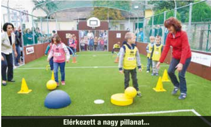
Elérkezett a nagy pillanat...

késlekedett, mert meg kellett építeni a pályát körbevevő kerítést - mondta a kis ovisoknak, akiknek és a pedagógusoknak kedves szavakkal mondott köszönetet a türelmes várakozásért. A városvezető elismerését fejezte ki a projekt megvalósításában résztvevőknek, a két alpol-