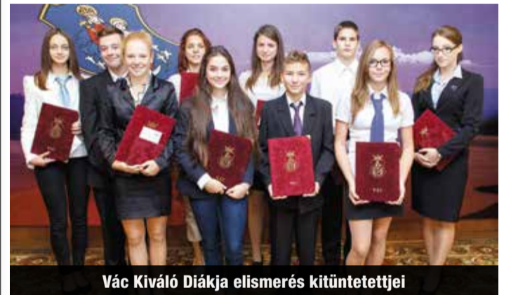
Vác Kiváló Diákja elismerés kitüntetettjei

Szeptember 18-án tartotta meg az önkormányzati választások előtti utolsó ülését Vác Város Képviselőtestülete. Ezzel négy év után leköszönt a mostani grémium.