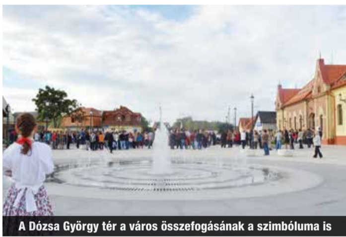
A Dózsa György tér a város összefogásának a szimbóluma is

A gazdag történelmi múlttal és hagyományokkal büszkélkedő Dunakeszi fejlődésének egyik legjelentősebb közösségépítő beruházásaként szeptember 22-én ünnepélyesen avatta fel a 6 ezer négyzetméteres alapterületű főtér a város diáksága és Diósi Csaba polgármester.